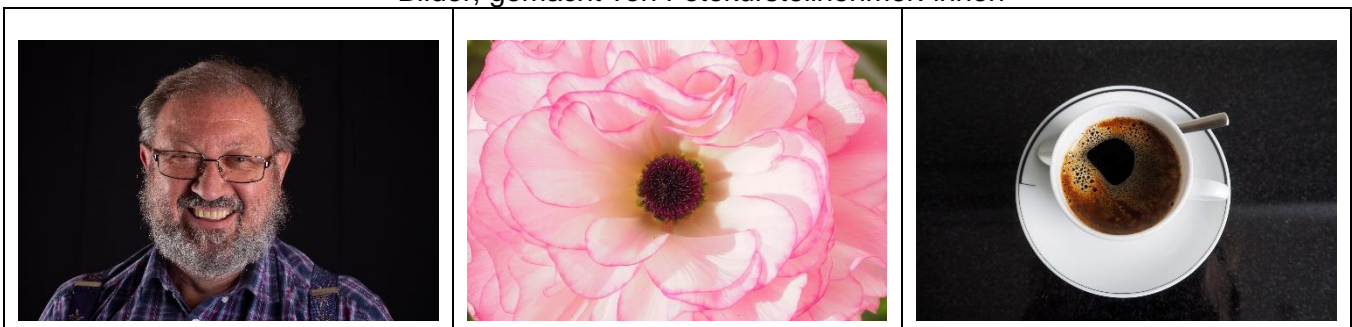
Bilder, gemacht von Fotokursteilnehmer: innen